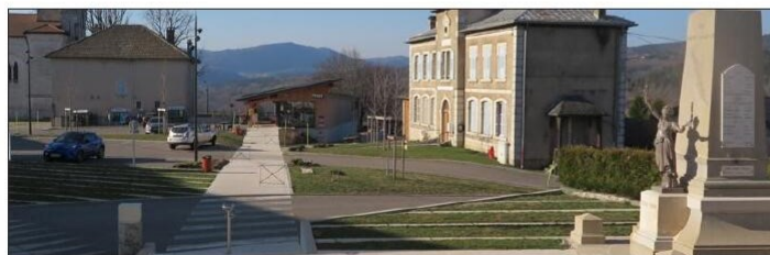
Le monument aux morts de la place a été déplacé devant la mairie dans le cadre des travaux de réfection de la place.

L'association Généalogie patrimoine et environs va enfin pouvoir présenter au public le fruit de son travail de recherche lors d'une exposition sur la place du village, la place Charles-Blétel.