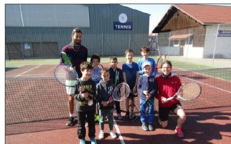
L'école de tennis organise des événements pour maintenir son budget pour ses 129 jeunes tennismen.