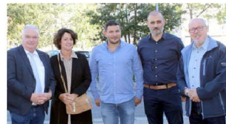
Les élus sont venus à la rencontre des habitants.

médiateurs, des chefs d'entreprise, des agences d'interim et des responsables RH de divers secteurs. Des offres d'emploi sont proposées aux intéressés avec la découverte d'une CVthèque sur le site de l'AEPV.