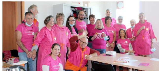
Les Blouses roses réunies à l'hôpital avec le personnel de 3M pour la journée de la solidarité.

Des salariés de l'entreprise 3M ont confectionné des tableaux tactiles d'éveil pour les chambres d'enfants de l'hôpital. Des livres ont été offerts aux enfants malades, ainsi que de la pâte à modeler, des crayons et des jeux divers. De petites peluches ont été offertes aux bébés du service maternité.