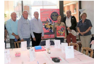
Le président et les membres du British Car Show (vente de billets pour une tombola dotée de nombreux lots).

Des bénévoles tiendront un bar ouvert tout au long de la journée de l'exposition. Un restaurateur servira des spécialités locales à 12 h. Champagne servi à 11 h. Un service thé est prévu à 16 h.