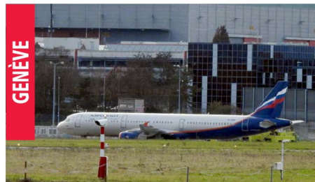
Cet avion de la compagnie Aeroflot a atterri à l'aéroport de Genève quelques jours après le déclenchement de l'offensive russe en Ukraine.