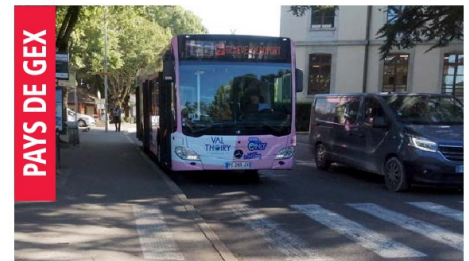
Les usagers du transport public vont devoir s'adapter. Confrontée à un problème de recrutement de chauffeurs, la région a dû revoir son offre.