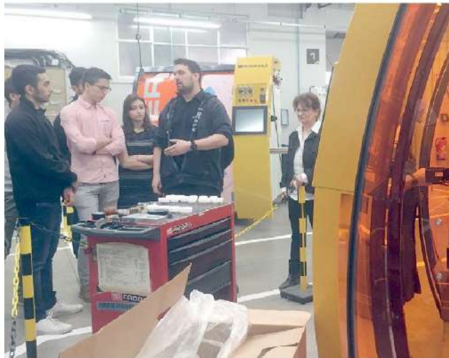
Des jeunes de l'INSA intègrent chaque année des entreprises de la Plastics Vallée.

cherche afin d'obtenir des explications. Réponse