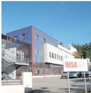
L'école d'ingénieurs de Bellignat accueille les futurs cadres de la plasturgie et de la plastronique.