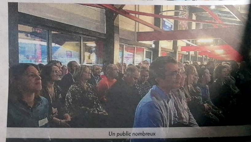
Un public nombreux