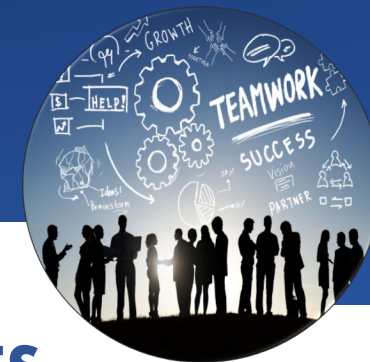
TABLE RONDE TÉMOIGNAGES CONFÉRENCE