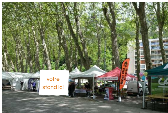
Stand sur le village départ Visibilité grand public – zone départ