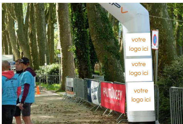
Arche départ de la course Visibilité grand public – zone départ