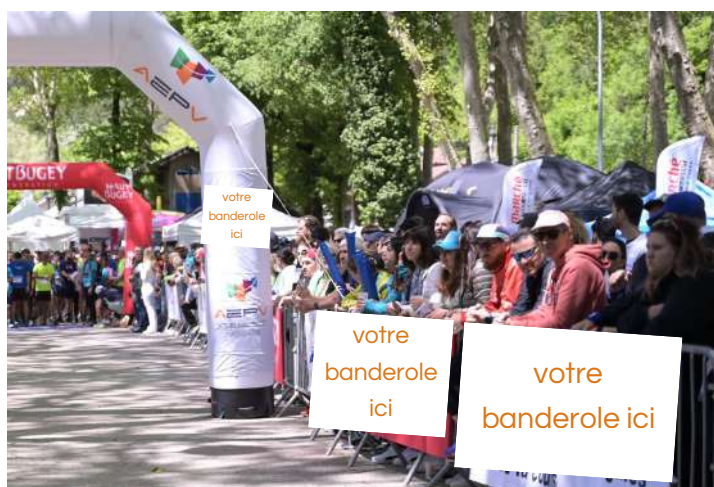
Banderole village départ À fournir par vos soins, ou avec un supplément technique par les nôtres