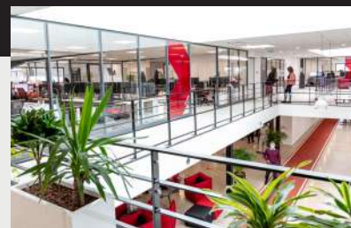
Siège XEFI - Rillieux-la-Pape (69)